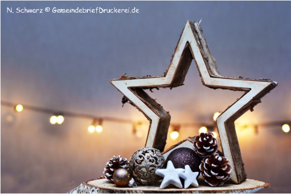
N. Schwarz © Gemeindebriefdruckerei.de