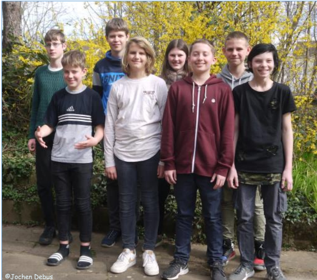
Konfirmanden*innen aus Eimeldingen (vlnr):