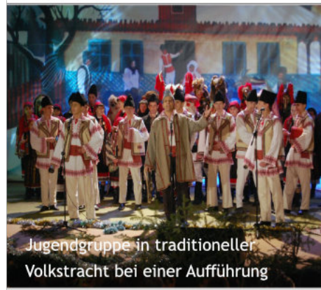
Jugendgruppe in traditioneller Volkstracht bei einer Aufführung

Gruppen zusammen und zogen durchs Dorf und haben am Abend Freunde, Bekannte oder Verwandte mit ihren Weihnachtsliedern erfreut. Zum Abschluss haben sie in einer Familie zuhause unter sich weitergefeiert.