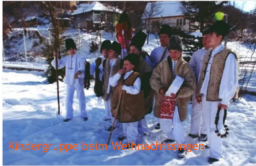
Kindergruppe beim Weihnachtsingen

erhalten. Jetzt freuten wir uns auf das vorbereitete Mittagessen. Traditionell gab es Fleischsuppe mit Gemüse, Bratenfleisch, eine Art Kartoffelsalat mit selbstgemachter Mayonnaise, Karotten und Erbsen und das Nationalgericht „Sarmale“ mit Schmand. Das sind kleine Hackfleischwickel in Weißkrautblättern gegart.