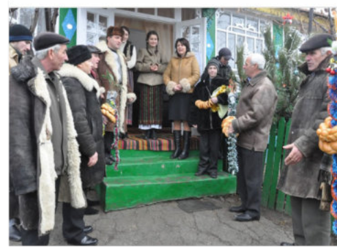
Gesangsgruppe bei einem „Ständchen“

Gruppen zusammen und zogen durchs Dorf und haben am Abend Freunde, Bekannte oder Verwandte mit ihren Weihnachtsliedern erfreut. Zum Abschluss haben sie in einer Familie zuhause unter sich weitergefeiert.